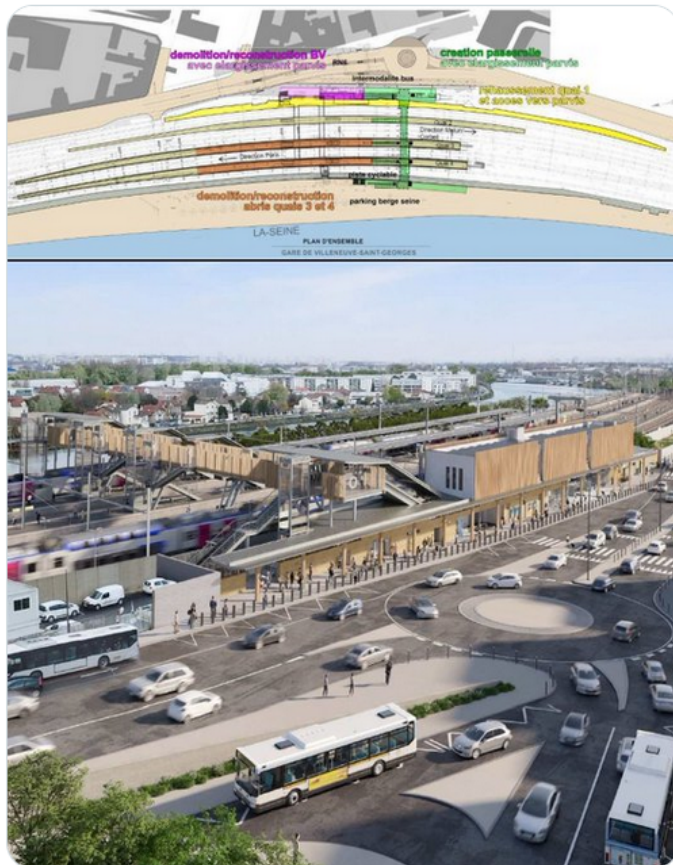
👤 SNCF Gares & Connexions et 7 autres personnes

Villeneuve-St-Georges RER : attendu de longue date, le projet global de réaménagement et mise en accessibilité est sur les rails : 143 M€ de travaux sur 2028-33 dont la création d'une passerelle. Mais on demande sa couverture complète, écartée pour une économie minimale 😞